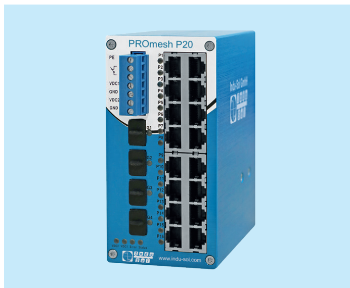
PROFINET Switch PROmesh P20