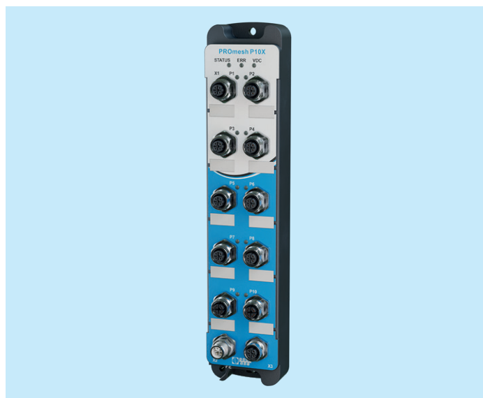
PROFINET Switch PROmesh P10X