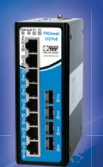
PROmesh B12 PoE