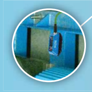
Usecase: Condition Monitoring einer Motorpumpen-Kombination

Mit dem selbstlernenden Teach-Mode und dem intelligenten Alarmmanagement ist der SIEDS-Sensor für jede Art von Condition Monitoring-Aufgabe in der vorausschauenden Instandhaltung einsetzbar und bietet die Möglichkeit unterschiedlichste Assets im industriellen Umfeld zu bewerten.