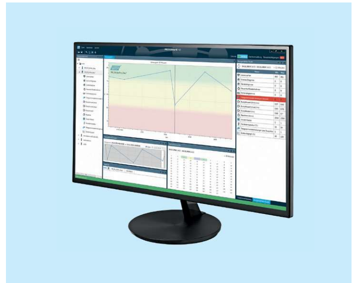
Netzwerküberwachungssoftware PROmanage® NT

Vertrieb Schweiz: Amriswilerstrasse 155 8570 Weinfelden +41 (0)71 626 58 80