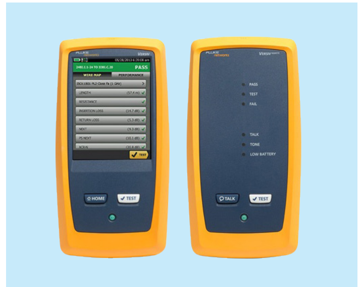
Leitungstester ETHERtest V5.1