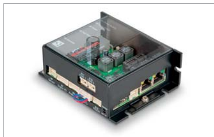
EPOS4 50/5 Positioniersteuerung