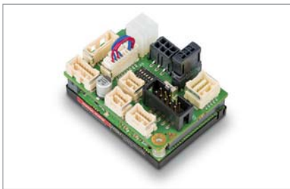
EPOS4 Compact 50/5 CAN