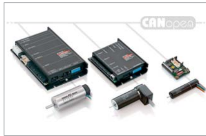
EPOS2 Positioniersteuerungen mit CAN

Die konkrete technische Lösung zur Anbindung von CAN-Geräten an PROFINET ist das PN/CAN-Gateway von Helmholz. Insgesamt fünf Typen sind für die verschiedenen CAN-Protokolle verfügbar, darunter auch eine Version speziell für das Profic iA® 402 series. Am PROFINET-Netzwerk ist das PN/CAN-Gateway ein PROFINET I/O-Device und unterstützt Übertragungsraten bis 100 Mbit Vollduplex, am CAN-Bus wird bis zu 1 Mbit/s unterstützt. Die I/O Daten der CAN-Teilnehmer werden transparent und frei konfi-