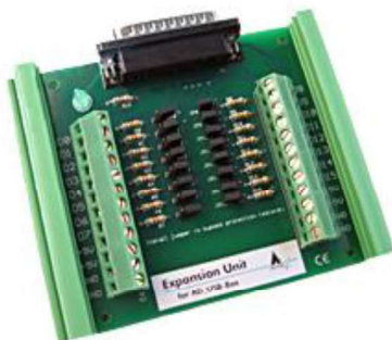
Expansion Unit für AD_USB-Box (im Lieferumfang enthalten)

Die AD_USB-Box verfügt über 8 massebezogene (single-ended) bzw. 4 differentielle analoge Eingänge sowie 4 digitale Eingänge. Weitere 16 digitale Eingänge (24 VDC) werden über die zum Lieferumfang gehörende Expansion Unit bereitgestellt. Diese Eingänge sind zusätzlich kurzschluss- und überspannungsgeschützt.