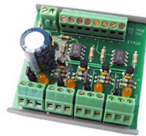
4-20 mA Strom-/Spannungswandler ET420 für 4 Kanäle (optional erhältlich)

Mit der AD_USB-Box können auch Ströme gemessen werden. Hierzu kann z. B. der optional erhältliche ET420 (4-20 mA Strom-/Spannungswandler) genutzt werden.