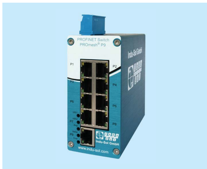
PROFINET Switch PROmesh P9