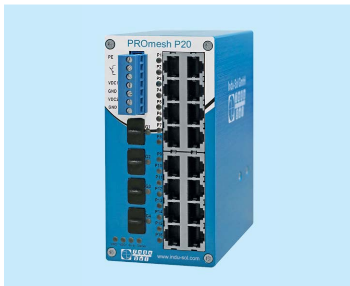
PROFINET Switch PROmesh P20